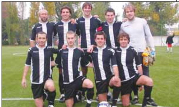
I giovani rampanti del "Costanza Junior"