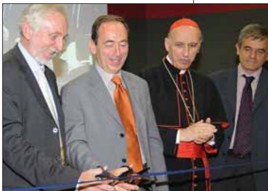
L'inaugurazione del nuovo polo didattico: da sinistra il rettore dell'Università di Torino Pelizzetti, il preside Bortolani, il cardinale Poletto e il sindaco Chiamparino