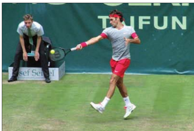
Roger Federer, il Ritmo per eccellenza: un fattore che regala fluidità ed eleganza alla performance. Avere un buon Ritmo permette di svolgere l'azione in maniera ordinata, precisa e puntuale.

ordinate, incondizionate da imprevisti. Queste ultime sono l'espressione di una buona gestione del fattore Ritmo. Non a caso spesso tali individui assumono ruoli di leadership, poiché il loro ordine, il loro essere armonici ed eleganti, ispira fiducia e affiliazione. Gli stessi elementi si dimostrano anche in campo: quando il giocatore arriva troppo in anticipo sulla palla, oppure in ritardo, quando non si prende il tempo necessario tra un punto ed il successivo, ma affretta eccessivamente e