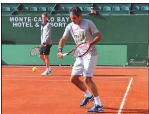
È possibile trovare il proprio Ritmo ideale ascoltando anche i propri ritmi biologici, quali il respiro, il battito cardiaco o semplicemente il rumore ritmico della pallina che rimbalza.

senza motivo la ripresa del gioco, quando il gesto non risulta fluido, e gli sta perdendo il controllo del Ritmo. Recuperarlo significa ritrovare il proprio Ritmo ideale e recuperare l'ordine, ascoltando anche i propri ritmi biologici, quali il respiro, il battito cardiaco, o semplicemente, ad esempio, il rumore ritmico della pallina che