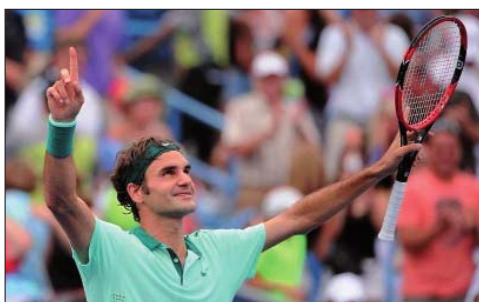
Gli individui ordinati e incondizionati da imprevisti sono espressione di una buona gestione del Ritmo e spesso assumono ruoli di leadership, poiché il loro essere armonici ed eleganti ispira fiducia e affiliazione.