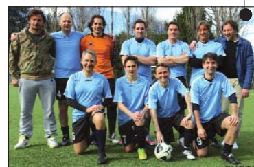
Fra le squadre partecipanti alla Kappa Cup 2015, gli Juniores, storica rappresentativa del Circolo della Stampa - Sporting