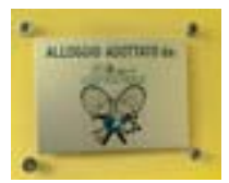
La targa apposta sull'alloggio adottato lo scorso anno da Circolo della Stampa Sporting, Monviso Sporting Club e Ronchiverdi.

Si torna in campo per il Torneo UGI di tennis, a favore della raccolta di fondi per l'adozione di un alloggio di Casa UGI, la Casa Accoglienza inaugurata nel 2006 nell'edificio ex monorotaia di Italia '61, dove sono ospitati gratuitamente i bambini malati di tumore in cura presso l'Ospedale Infantile Regina Margherita. Il record da battere è la cifra di 11.300 euro raccolta lo scorso anno: tutti invitati, dunque, a partecipare al torneo di doppio femminile e a quello maschile (già in corso con finale in programma il 10 giugno), che anche quest'anno sono abbinati a un torneo di bridge a coppie libere (mercoledì 8 giugno ore 15.30) e a un torneo di burraco a coppie fisse (mercoledì 15 giugno ore 20.30). Il grande evento si concluderà poi mercoledì 15 giugno, dalle ore 18, con la premiazione, la lotteria e l'apericena presso il ristorante del Circolo. Ecco i contatti per le iscrizioni: