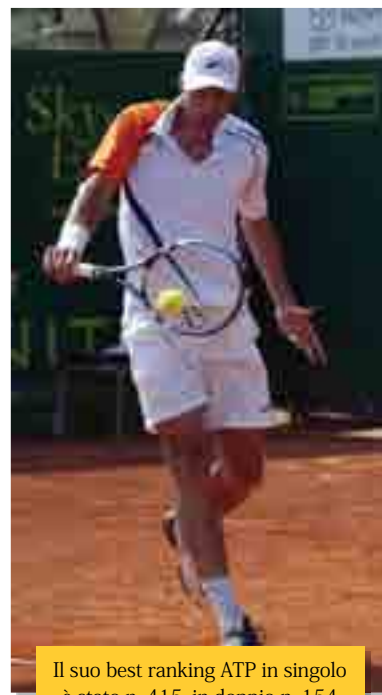
Il suo best ranking ATP in singolare è stato n. 415, in doppio n. 154

riguardano anche la sua attività giornalistica, perfettamente in linea con un club come il Circolo della Stampa Sporting: "Il mio sogno era fare il giornalista, a