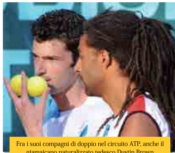
Fra i suoi compagni di doppio nel circuito ATP, anche il giamaicano naturalizzato tedesco Dustin Brown

gruppo di professionisti molto uniti e motivati: io resto un uomo di campo, per la parte organizzativa avrò un appoggio in Simone La Pira, mio vice. L'intenzione è quella di dare a tutti continuità e tranquillità proseguendo sulla strada che era già stata avviata dal mio predecessore Gianluca Luddi". Pronti via, dunque, senza tuttavia trascurare le antiche passioni che