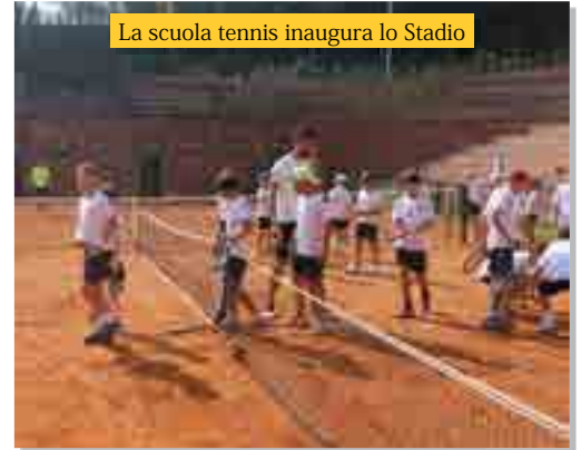
La scuola tennis inaugura lo Stadio