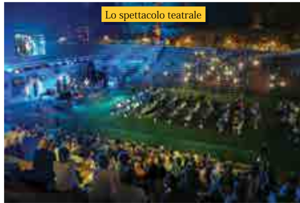
Lo spettacolo teatrale