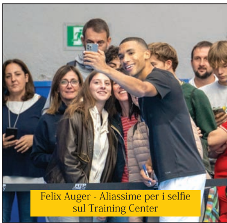
Felix Auger - Aliassime per i selfie sul Training Center