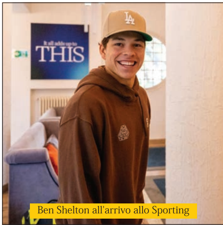
Ben Shelton all'arrivo allo Sporting

Tennis Padel e politica sciolgano le riserve e trovino finalmente un accordo: com'è noto, infatti, visti il successo organizzativo e la conseguente ricaduta economica delle Finals all'Inalpi Arena, il Governo sta tentando di entrare pesantemente nella gestione della manifestazione, alla quale collabora con un finanziamento che, in caso di rifiuto, minaccia di ritirare.